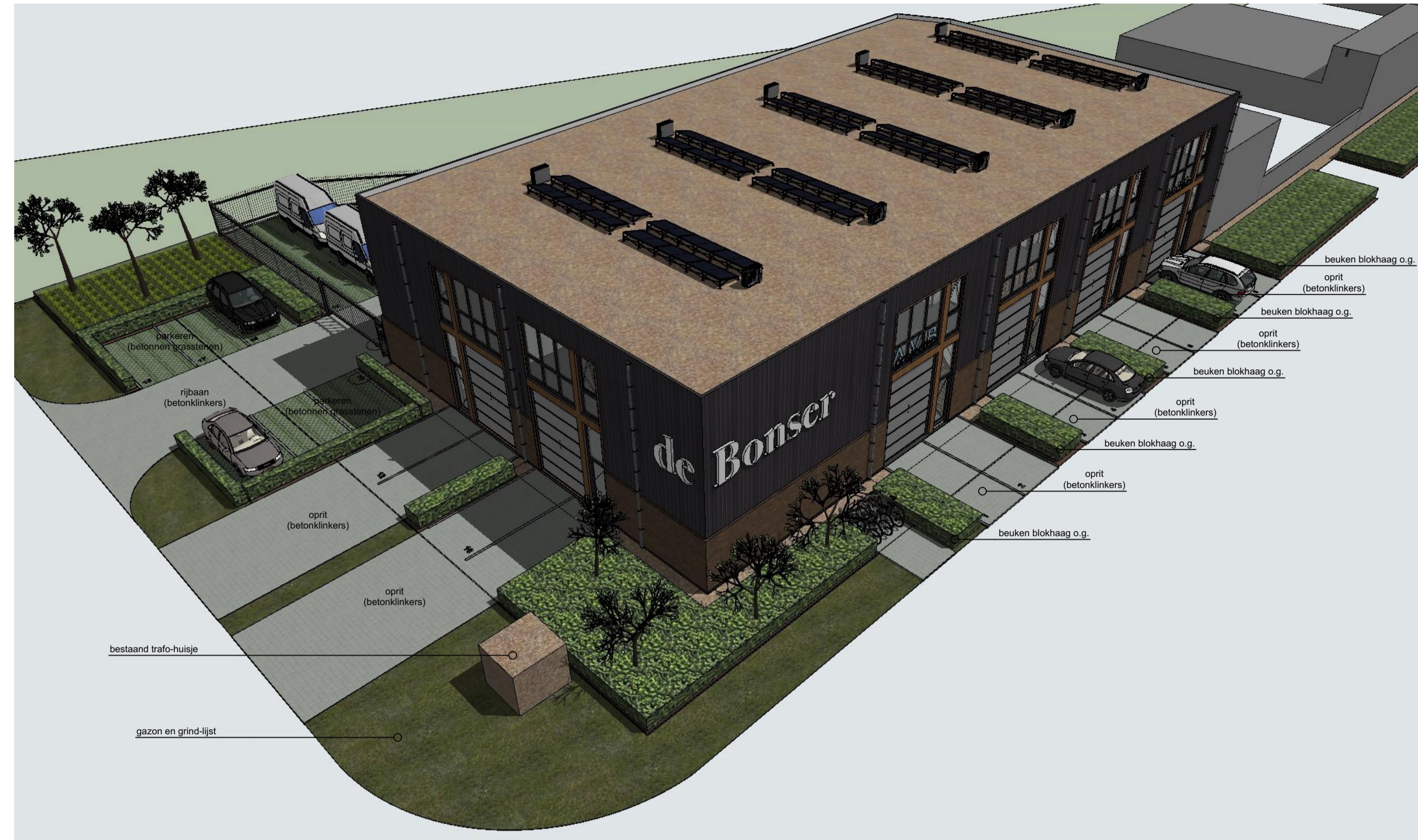
vv01 vogelvlucht noordzijde