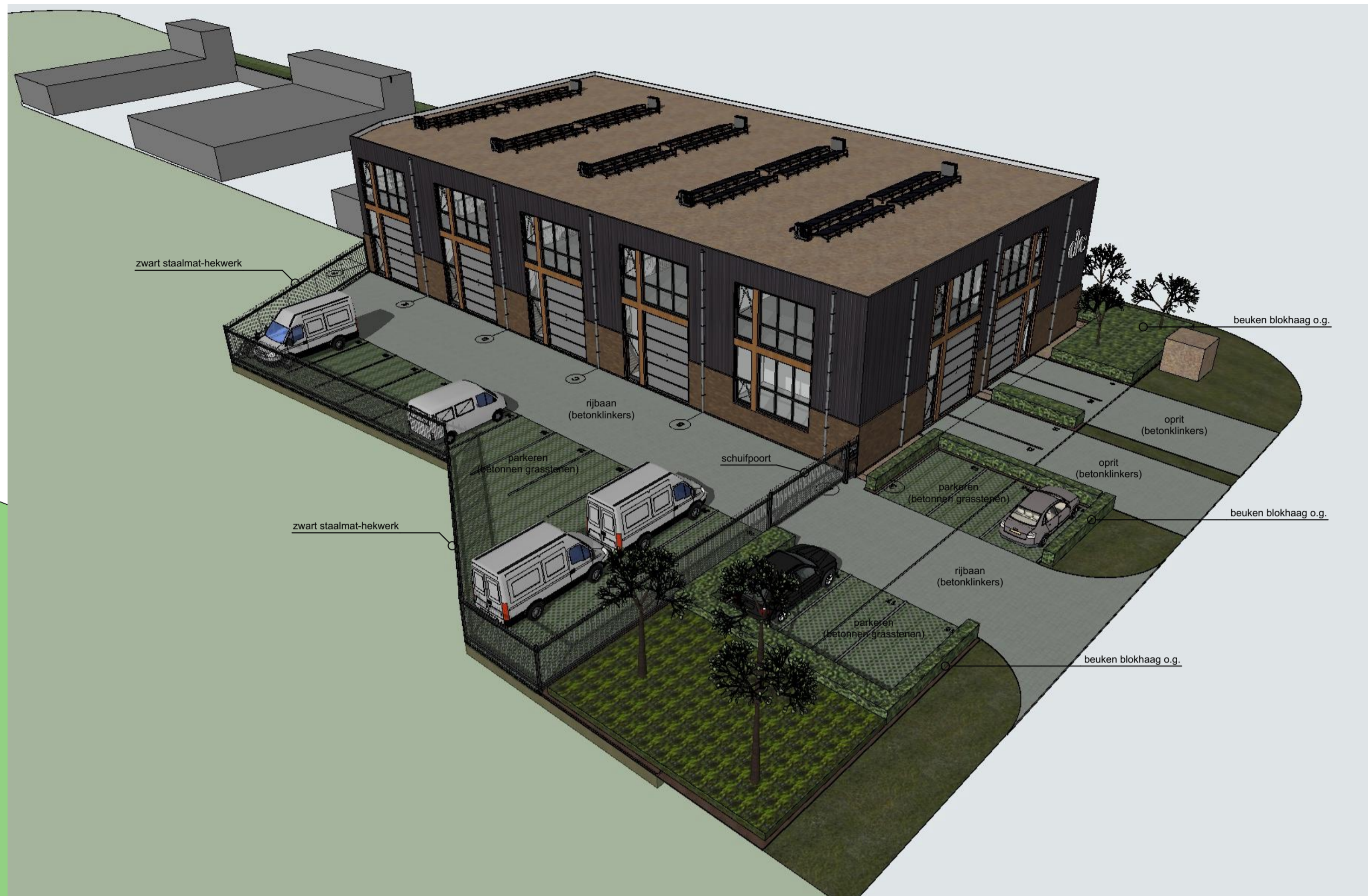
vv02 vogelvlucht oostzijde _ochtend